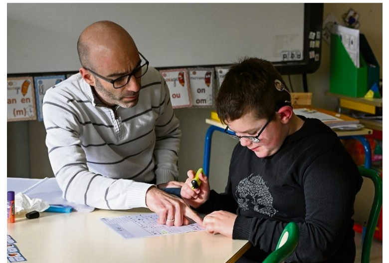
Au sortir de l'IESHA, les jeunes en situation de handicap auditif sont invités le plus souvent à s'orienter vers des structures professionnalisantes. Mais il n'en existe guère dans l'Yonne.